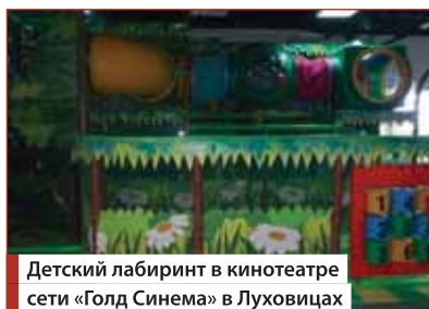
Детский лабиринт в кинотеатре сети «Голд Синема» в Луховицах

БК: Как вы выбирали мебель и необходимое оборудование для кинотеатра? На каких решениях остановились и почему?