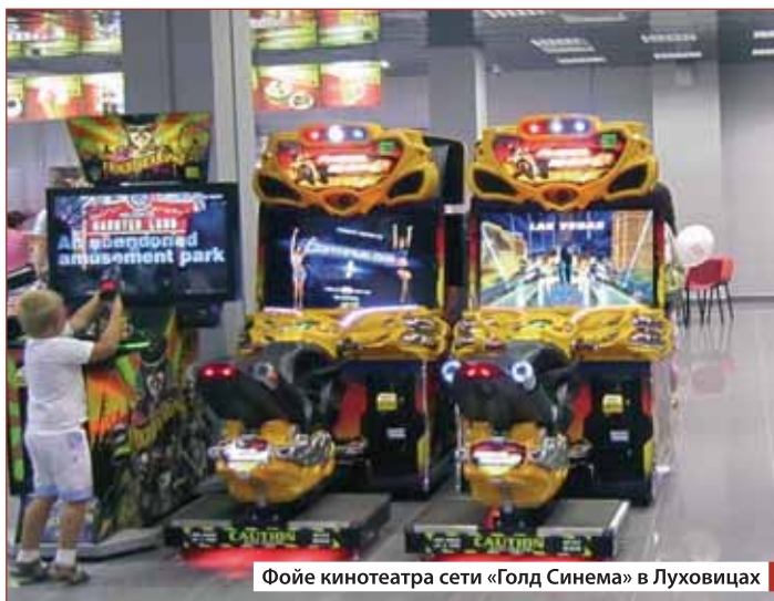
Фойе кинотеатра сети «Голд Синема» в Луховицах

ЗАРУБИН: Для взрослых мы включили в программу показа два фильма – ПРЕЗИДЕНТ ЛИНКОЛЬН: ОХОТНИК НА ВАМПИРОВ Тимура Бекмамбетова и ПРОМЕТЕЙ Ридли Скотта. А детей мы порадовали долгожданными мультипликационными новинками МАДАГАСКАР 3 и ЛЕДНИКОВЫЙ ПЕРИОД 4: КОНТИНЕНТАЛЬНЫЙ ДРЕЙФ, которые у нас можно было посмотреть и в формате 3D.