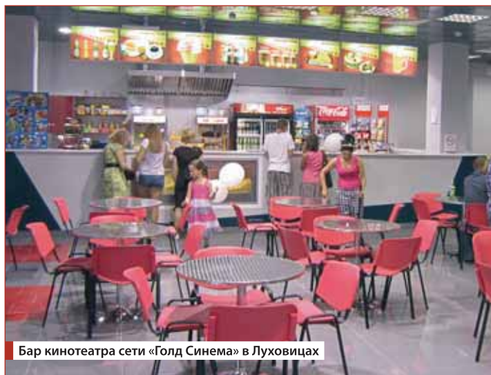
Бар кинотеатра сети «Голд Синема» в Луховицах